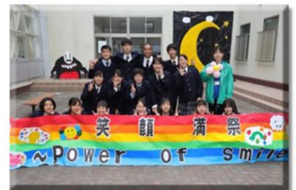
進学相談会・生徒会懇談

※オープンスクール参加を希望される方は、 各中学校の担任の先生を通じてお申し込みください。