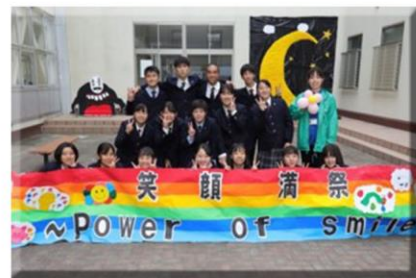
進学相談会・生徒会懇談

※オープンスクール参加を希望される方は、 各中学校の担任の先生を通じてお申し込みください。