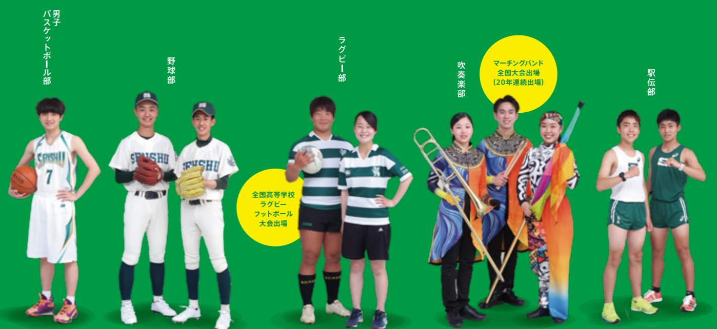
男子 バスケットボール部