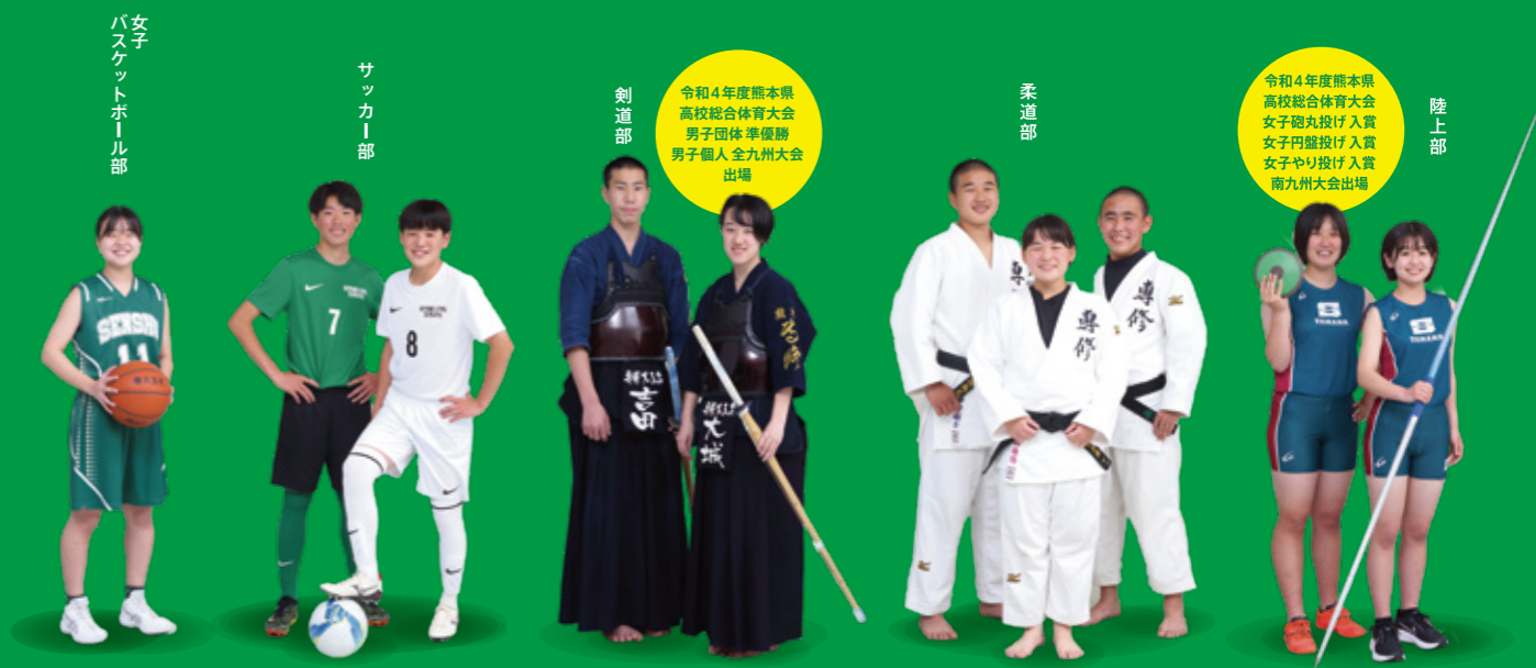
女子 バスケットボール部