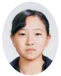
普通科 文理選抜コース 南 南 （玉名中）

私にとって、専修大学玉名高等学校の吹奏楽部はあこがれでした。毎日一生懸命練習されている先輩方の演奏は聴く私たちに笑顔と感動を与えてくれました。私も誰かを笑顔にしたい、元気にしたいと思い、志望しました。